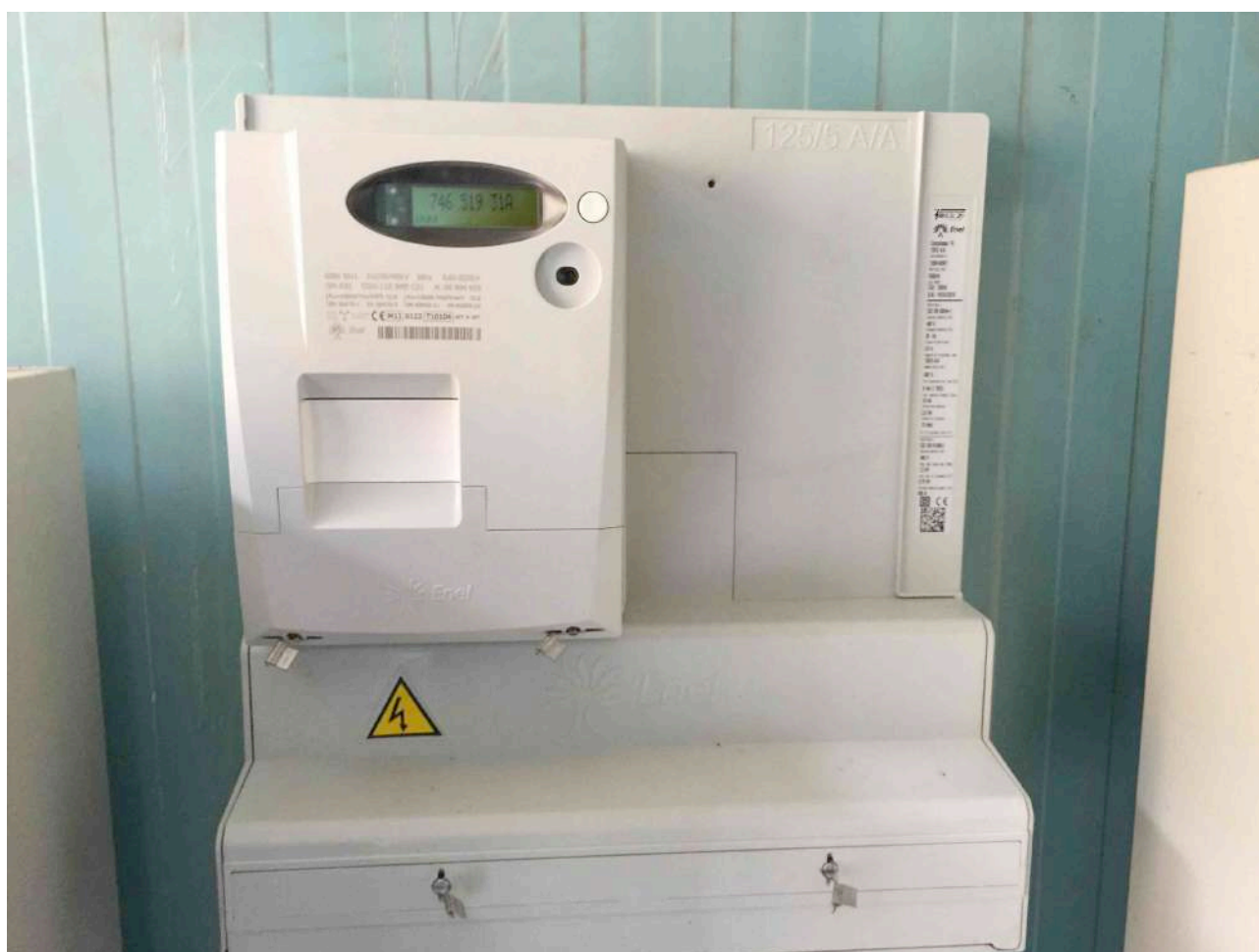
Foto n. 11 (contatore di produzione Enel con TA sigillati da Enel)